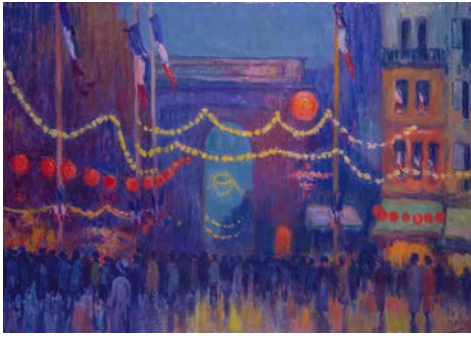
Soir de 14 juillet