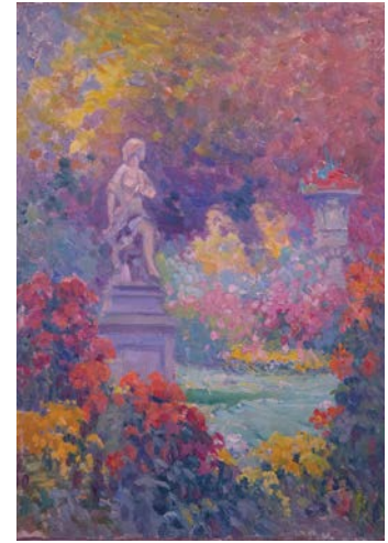
Roseraie avec statue de femme