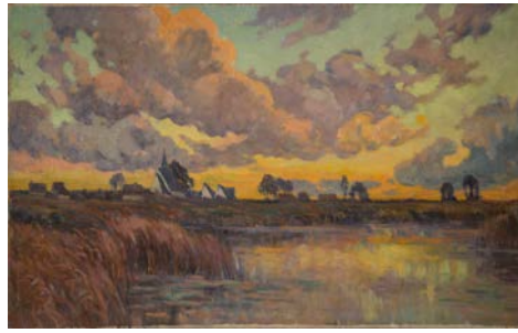
Étang de Loreux