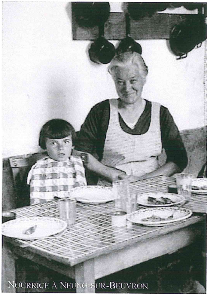
NOURRICE À NEUNG-SUR-BEUVRON