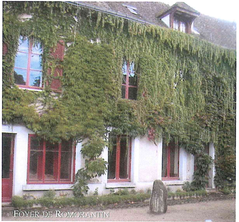
FOYER DE ROMORANTIN