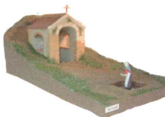
Fontaine Saint Genouph à Selles-St-Denis