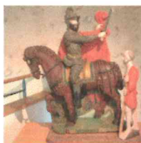
« Charité St Martin » bois polychrome du XVI e siècle.